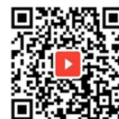
スマートコロナパス デモ画面動画

報道関係の方からのお問合せ 東武トップツアーズ株式会社 経営戦略部 広報担当 TEL:03-3622-6215